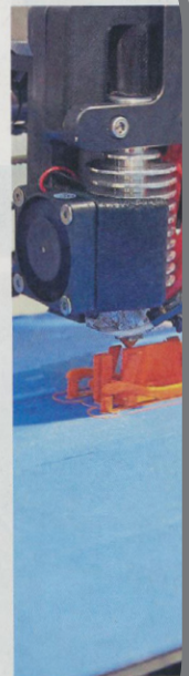
Am 3-D-Drucker entsteht ein Minischaukelpferd.

Pinolino | Der kippssichere Lauflernwagen „Feuerwehrauto Klaus“ oder das mit Kreide individualisierbare „Steckenpferd Sabrina“ sind nur zwei Beispiele für die Produktvielfalt von Pinolino Kinderträume aus Münster. Noch mehr zu sehen gab es auf drei Messen für Fachbesucher und Endkunden, der „Kind + Jugend“ in Köln, der „spoga + gafa“ ebenfalls in Köln und der „Baby Cool“ in Paris. Erstmals aus dem 3-D-Drucker schlüpfte als Miniatur das Schaukelpferd „Pinolino“ – erhältlich ist es aber auch als Riesenschaukelpferd. Ebenfalls vorgestellt wurden Kinderzimmer aus Massivholz, unter anderem im Landhaus-Stil, teilt das Unternehmen mit.